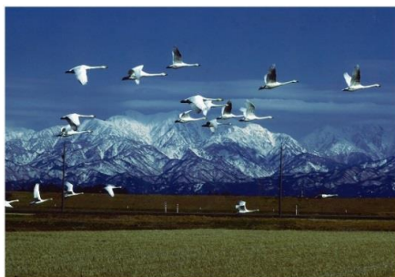
タイトル 『躍る白銀』