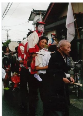
タイトル 『祭りの日』