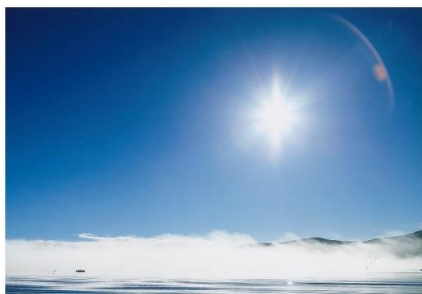
タイトル 『神通の静寂』