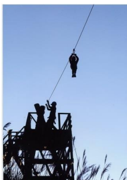
タイトル 『秋の切り絵』