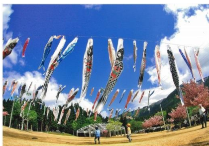
タイトル 『天高く』