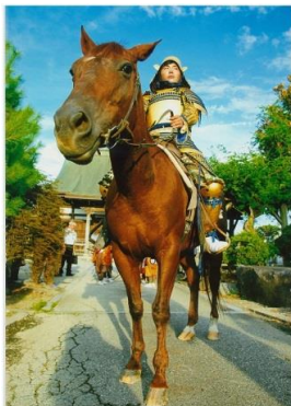
タイトル 『威風ドオードー』