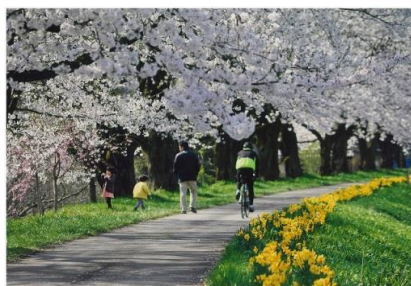
タイトル 『家族』