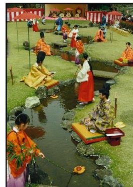
タイトル 『曲水の宴』