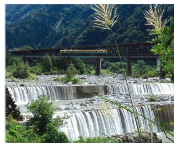
タイトル 『秋の気配』