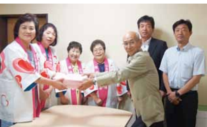
6月11日 小矢部市女性団体連絡協議会よりアンケートを受け取りました

皆様の貴重なご意見をもとに、アウトレット所在地での動向を分析し、商店街誘客に繋げていきたいと思っております。