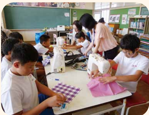
ベンチャーキッズ事業

を応援しております。「商工会の日」の六月十日には市内四介護施設を訪問し、部員善意のタオルの寄贈、また定期的に清楽園を訪問し介護のお手伝いを続けております。今後もボランティア活動やベンチャーキッズ事業等を通して社会に貢献していきたいと考えております。