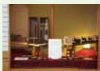
薄水本舗五郎丸屋