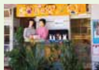
ヘアサロンしまだくん