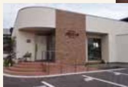
駐車スペース増えました