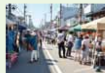
クラフトマーケット