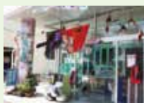
クリーニング六谷

店主が自らのアイデアで作ったアート作品・子供たちが描いた布絵・オリジナルのクラフトが通りを飾りました。