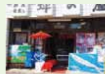
鮮魚仕出し坪の屋