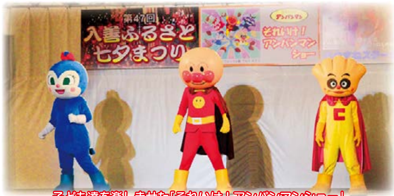
子ども達を楽しませた「それいけ！アンパンマンショー」