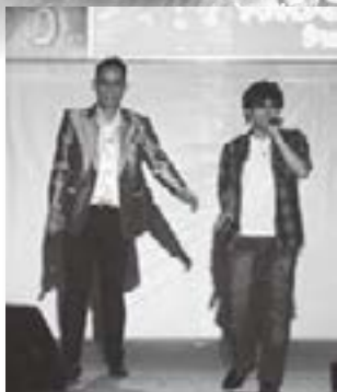
本物そっくりなパフォーマンスに大盛り上がりとなった「ものまねステージ」