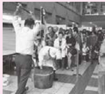
入善町菓子組合による もちつき体験&振舞い