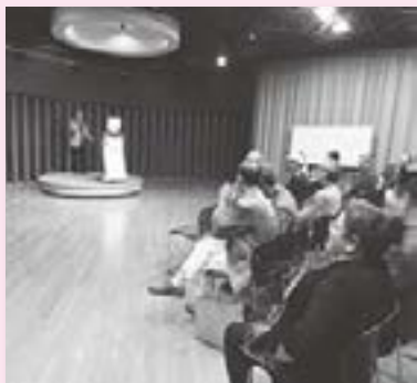
オープンカラオケinまつりんぴっく

雨天のため、プロムナードやマルチルームにてご出演をいただき会場を盛り上げていただきました。