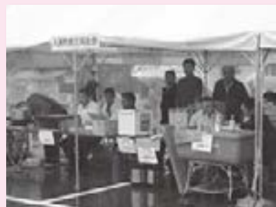
同友会(飲食ブース)