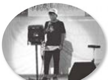
オープンカラオケBOX