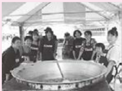
女性部(シャケ鍋振舞い)