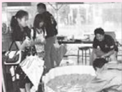
青年部(縁日コーナー)