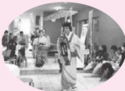
ちんどん屋 「おらっちゃん人生桜歌隊」出演