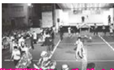
入善音頭街流しニューバージョン披露