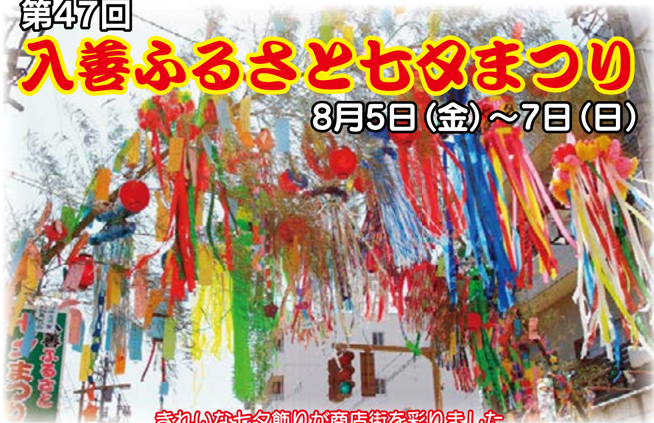
きれいな七夕飾りが商店街を彩りました