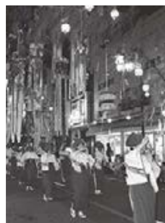
ふれあい入善音頭街流し競演会優勝「スポーツクラブ入善」