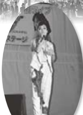
伸びやかな歌声が会場を魅了した「梢ライブ」