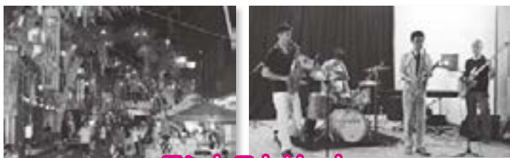
テントストリート