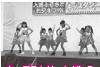
キッズストリートダンス・キッズヒップホップダンス