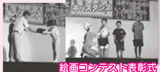
絵画コンテスト表彰式