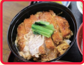
みなみのかつ丼 (麵房みなみ)