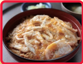
海老天じ丼 (天よし亭)