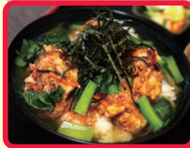
射水産小松菜とからあげのあんかけ丼 (うどん万福)