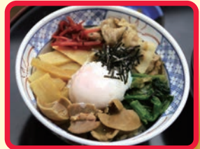
やみつき「もつ」丼 (麵処 煮込亭)

「ふるさと商工まつり in 射水」の会場にて、長野県地域の特産品販売を行った。当日は、蕎麦、味噌、せんべいなどを入荷し、長野地域のPRを行った。