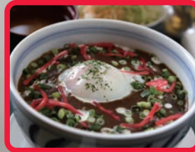
射水 たけのこカレー丼 (Gomesさん)