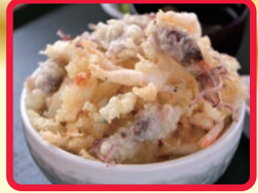
新湊丼 (道の駅新湊)