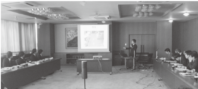
研究人材能力活用事業(生産管理部長体験)の報告会で発表する県立大学生

各企業の社長等の説明で工場内を見て回った学生達は、アドバイザーの布目中小企業診断士の指導の下「生産管理部長」として、5S（整理・整頓・清掃・清潔・躰）の視