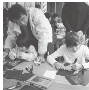
金属の板でレリーフ(浮彫)作りをする児童たち

参加した児童は、初めて経験することも多く、悪戦苦闘しながらも、職人になった気分で作業をすすめ、完成させた達成感を味わうとともに「ものづくり」への深い興味を抱いていた。