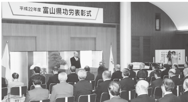
県庁で執り行われた「富山県功労表彰式」

県商工会連合会が「平成二十二年 度 富山県功労表彰」を受賞することとなり、その表彰式・祝賀会が十一月二日、県庁等において執り行われた。