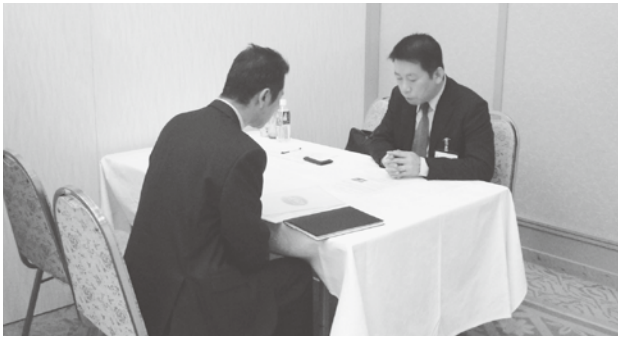
バイヤーと商談する食品製造小売業者

本会では、バイヤーによる商品評価シートを事業者へフィードバックすることによって、