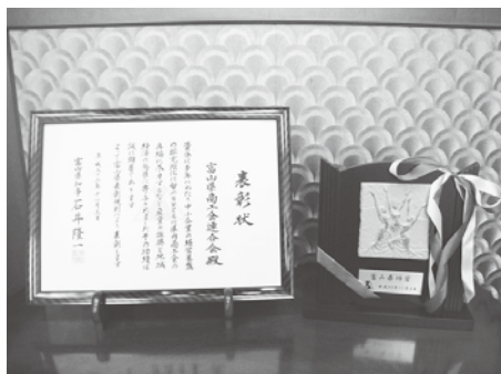
授与された表彰状と盾(たて)

今後は、この受賞を励みに、地域総合経済団体として、より一層 商工業者への支援と地域の振興発展に努力していくこととし、関係者が決意を新たにしたいところである。