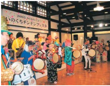
イベントに定着したチンドンフェスタ

して信頼関係を築き地域商業の活性化を目指します。お楽しみ抽選会や旬満喫のいのくち鍋・黒豆おにぎりなども販売されます。