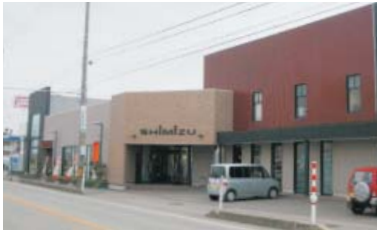
シックで落ち着いた雰囲気のある店舗