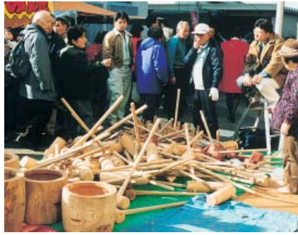
正月用品など多数販売される歳の大手

慶安三年の町立てとともに二と七のつく日に市が許されて以来、三百五十年余り。朝市は四月から十二月まで続けられ毎年最後の十二月二十七日には、「歳の大手」が開かれている。