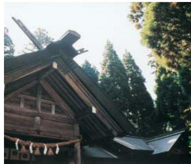
今年も大勢の参拝客が予想される榎田神社