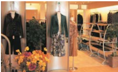
高級感をイメージした店内

インターネット ショッピング、 インテリア部門 へも進出し、常 に敏感に情報収 集し、ワンラン ク上の満足感を 提供できるよう に心がけている。