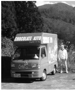
利賀生まれの手作りチョコレート販売する移動車と

お客様に好評を得て、今年のバレンタインデーにはアピタ・ユニー系列で限定販売され、早々と品切れになるくらい。また、販路の拡大ではチョコレート販売できるお店