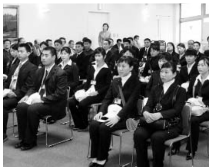
中国遼寧省からの56名の研修生