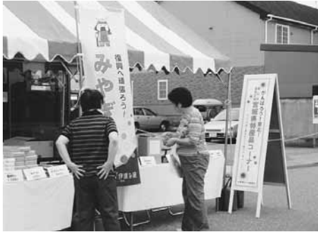
水橋橋まつりでの物産展

富山市北商工会では、水橋橋まつりにおいて、宮城県の特産品を販売し、売上金と当日募集した義援金を宮城県連に送金した。