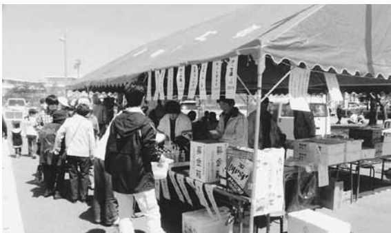
イベント会場で義援金の募集

県青年部連合会では、被災地青年部連合会が開設した預金口座へ、各商工会青年部で実施するイベントの際に募集する義援金を直接振り込むことで、被災地県青連の活動を支援することとした。