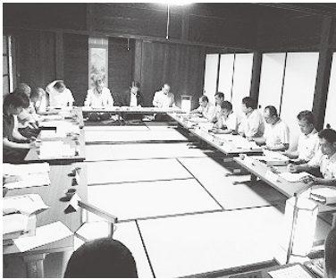
合掌の里「竹中家」で開催された第1回実行委員会

委員会では、空き屋の合掌造りの活用実験、周辺にある和紙や民謡、食文化などの地域資源を再評価又は発掘し、その資源を活用した着地型観光の模索と地域ブランド商品を創出することとした。また地域コールドパイプを受け、十二月までに次年度からの事業化に向けた取り組みの方向性をまとめる事としている。