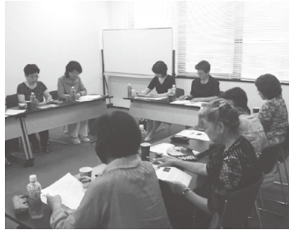
会議を重ねる女性部員

十月十三日(木)から二日間にかけて開催される第十三回商工会女性部全国大会inとやまの実施概要がまとまった。 十三日の大会初日には、女性部員等による富山を象徴する民謡等によるオープニングセレモニー、女性部結成四十五周年記念事業に関する事業報告並びに表彰式を中心とした大会式典、全国の五ブロックの代表となった女性部員が日頃の女性部活動等を発表する主張発表大会、そして基調講演として、立山博物館の米原寛館長より「立山信仰