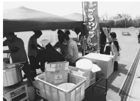
登米市での炊き出し

宮城県気仙沼市を訪問し、興福寺と光ヶ丘保養園において、うどんの炊き出しを実施した。また、青年部より学童用文具を贈呈した。