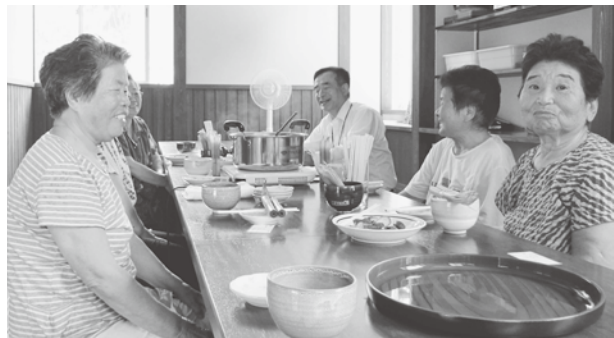
歓談する地元の人たち

栽培、製造に取り組みました。バタバタ茶ができるまでには、茶摘↓裁断↓蒸らし↓切り替えし↓乾燥の工程を要します。高品質のお茶を製造するには、これらの工程で人の感に頼るところが大きく、その技術の伝承が課題となっています。