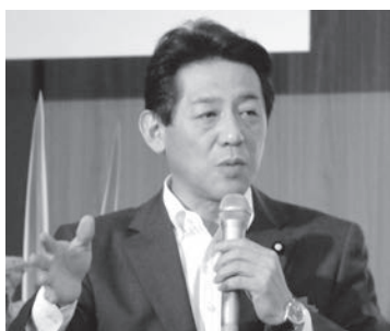
講演される 松村祥史経済産業副大臣