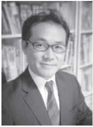
不動産鑑定士・行政書士