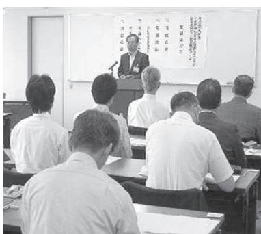
長期コース開講式に臨む受講生

県内経済・産業を支える中小企業の人材養成研修事業、富山県中小企業大学校は、今年度、「とやま中小企業人材育成カレッジ」としてリニューアルし、リーズナブルで質の高い研修を実施する。中でも、本研修事業のメインである経営後継者・幹部養成コース（長期コース）の開講式が六月二十七日に受講生二十一名にて執り行われ、幅広い経営知識と顧客や部下から信頼される「経営マインド」を身に付けることを目標に、全二十一日間に渡る研修が始まった。また、ものづくり分野やマーケティングなどの各テーマに応じて受講できる短期コースでは、現在受講生を募集している。