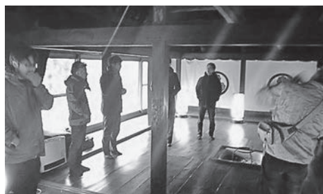
東祖谷落合集落の「麓庵(ちいおり)」視察