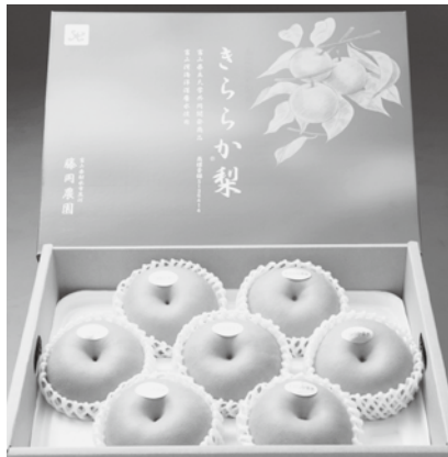
全国展開支援事業に採択された「きらら梨(射水市)」

理を提案してもらおうレシピコンテストや県内外から会員を募集し、収穫体験等を行う企画など、住民等へのプロモーション活動も展開し、ファンの輪を広げるとともに、交流人口の拡大にも繋げていく。商工会では、六月に市や観光協会、梨の生産者、飲食関係者、マーケティング専門家らで組織する委員会等を立ち上げ、具体的な協議や取り組みをスタートさせる。