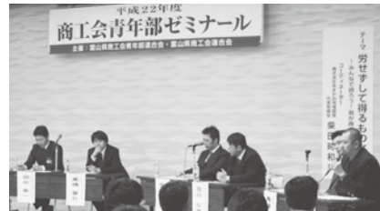
「商売と青年部活動」について熱い議論を交わすパネラー

人に頼れば大丈夫と信用をつかむこと、経営者や後継者、従業員等の個々の資質向上がひいては会社の成長に繋がること、地域に根づいた経営を基本とする「商売と青年部活動」については、「青年部は商売人の集まりで同業種・異業種を問わず情報共有ができ、多くの人脈も作れること、自己の人格形成やモチベーションアップに繋がると、一人でできるキャパは限られているので、助け・励まし合える仲間がつかれること、経営全般の支援をしている商工会をもっと活用したら良いのではなかいか」など熱い議論が交わされ、改めて商売を考える良い機会となった。