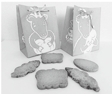
枝豆とかぼちゃを使った「クッキー」とキャラクターデザイン入り「紙袋」

また、そのクッキーの紙袋も「カーモ君」のキャラクターデザインを印刷し、食べ終わった後は、物入れとして再利用できる環境にやさしいものとした。今後は、今回開発した「カーモくんクッキー」を村の特産品として、各種イベントや物産展等でPRしていくとともに、贈答用の化粧箱の製作なども検討することとしている。