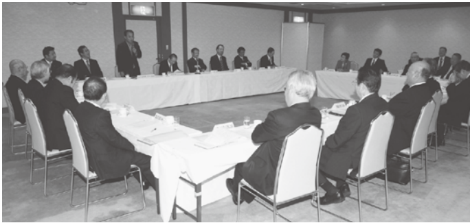
22年12月1日、「県商工会議員連盟との懇談会」で平成23年度の商工会関係予算を要望

商工会への補助金の内、事業費に係る主なものは、本年十月に本県で開催される「商工会女性部全国大会 in とやま」に対する補助が新規に盛り込まれたほか、二十一年度にスタートし、コスト削減に繋がると企業に好評である「省エネ診断事業」、専門的な技術・技能を有する専門家を派遣する「エキスパート派遣事業」、人づくり支援等の「中小企業大学等事業」、まちの魅力アップサポーター設置等による地域商業等活性化・まちづくり支援、ものづくり産業の育成、創業支援などの諸事業について