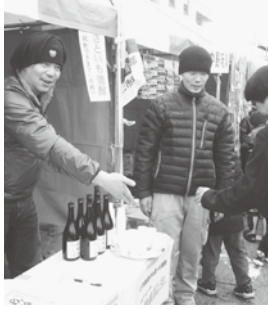
「剣岳雪のフェスティバル」での試飲会

その焼酎は、フルーティーでマイルドな味に仕上がりに、癖の少ない飲みやすさが特徴。普段