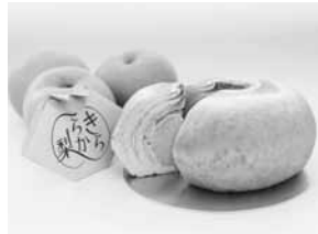
きららか梨を使った「バウムクーヘン」と統一の「ロゴマーク」

今後も、きららか梨を使った商品の全国各地への販路拡大を目指した活動を続けていくと