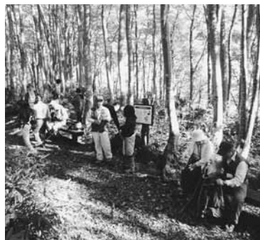
紅葉の牛岳で「ブナ林」を散策

今後は、今回の事業に参画した事業者の自発的かつ継続的な事業実施体制を支援するとともに、新規事業者の発掘と雇用機会の創出に結びつけたいと考えている。