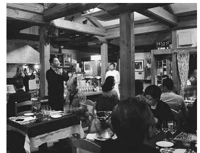
イタリア料理店「エルパッチャ」で開催された八尾食談議

観光スタイルを定着させたいと、テーマを明確にしたツアープログラムの作成や観光ボランティアの充実等の取り組みを行い、インタープリターをガイド役とした「まちなか散策」と「自然散策」の五コースを実験的に実施した。