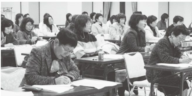
講師の説明に共感する女性部員

また講演終了後、平成二十三年度に本県にて開催される「商工会女性部全国大会 in とやま」について、夏野会長がこれまでの準備委員会での協議内容等を報告し、富山大会を成功させるため、全部員一丸となった協力を要請した。