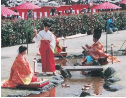
平安の雅を平成の世に再現

十六日(日)婦中町自然公園内の北叡山各願寺で開催される。曲水の宴は、流れる水に浮かべた酒杯が自分の前を通過するまでに和歌を詠む宮中行事で、平安時代に各願寺で行われていたもの。 短冊を手にした男女が、十二単衣や衣冠束帯など平安時代の衣装に身を包み、箏曲の調べが流れる中、思い思いの和歌をしたためる。毎年春の