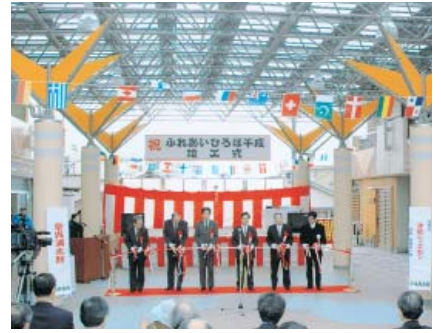
にぎわいの拠点に全天候型アーケード

街地活性化基本計画を策定し、その後、千成商店街協と商工会が中心市街地活性化法に基づくTMO計画の中で、市街地整備事業として進めてきたもの。