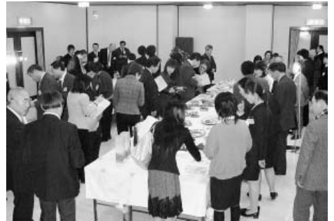
生産者が製法などを説明してPR

食品部門から八品目が出品され、出品事業者による商品の特長、製造の工夫など、熱心な商品説明に対し、流通業者からは、商品量や味付け、包材、価格設定など、販売者側の立場からの意見が投げかけられた。