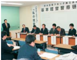
議論を交わす参加者