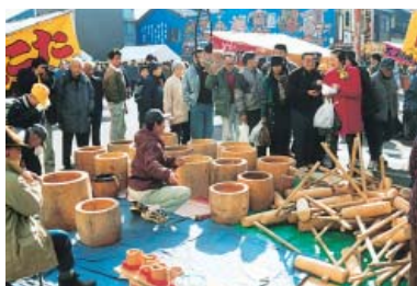
12月27日 福野蔵の大市