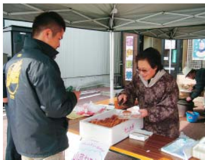
つごもり大市で販売されたシルクコロッケ

シルクパウダーは砂糖のよくな甘みと、良質なアミノ酸を含み、コロッケに入れるとうまみを向上させる効果をもっている。