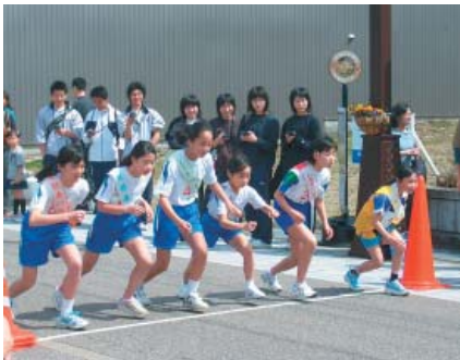
小中学生の駅伝競走大会

風物詩になっているこの行事は、桜が咲き誇る中での雅な風景が観賞できる。 その他、富山藩主人山行列や古典文化の催しもあります。