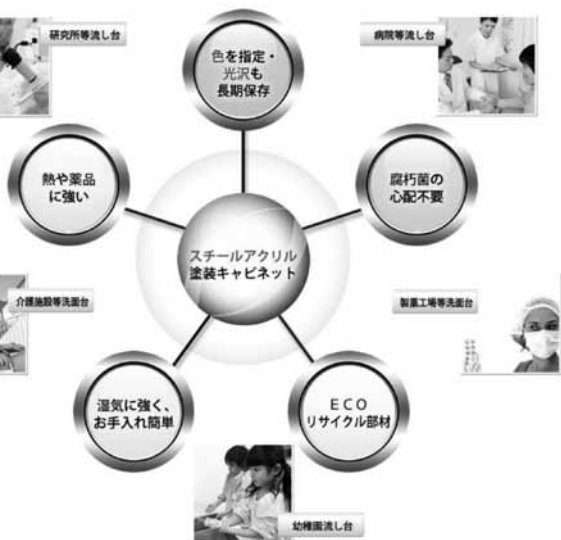
商品のメリットをわかりやすくビジュアル化して相手に伝える

まず、市場の明確化に取り組んだ。ターゲットとしては、従来の建築設計事務所や大手ゼネコンや地元ゼネコンに加え、県市町村が運営する公的施設、病院、高齢者福祉・介護施設、幼稚園、小学校等教育施設、衛生面を重視する民間企業（薬品製造業等）、従業員等の福利厚生の実現を図る民間企業などの新築・増改築の箱もの施設を抽出。また、首都圏において代理店活動ができる営業連携先も検討する。