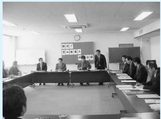
▲県商工同友会と長野県青年同友会の意見交換