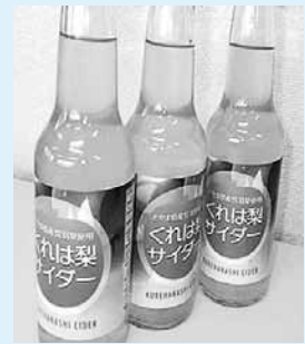
▲富山市北商工会女性部開発の くれは梨サイダー