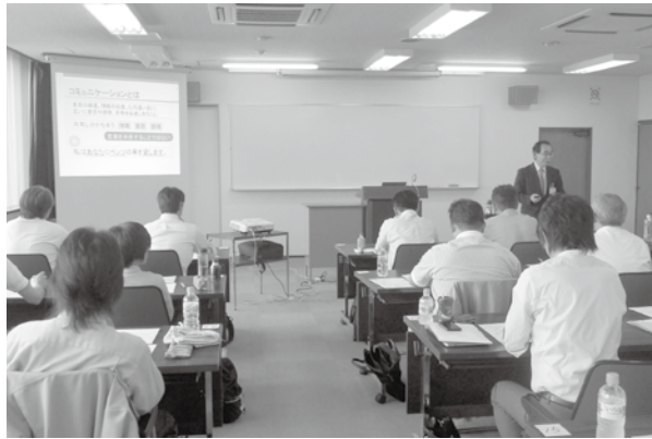
長期コースの受講風景

若手リーダーの養成などの短期コースが用意され、これまで二つのリーダー養成コースが合わせて八十名の受講により実施し、今後とも次の通り実施される。 人材育成・労務管理コース (成果創出型の人材マネジメント)、生産性向上コース (原価管理とコストダウン、生産現場の工程と品質