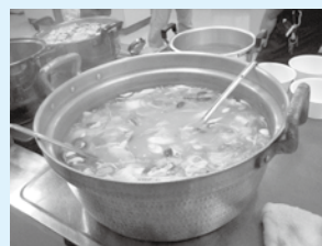
▲高岡市商工会青年部「しし鍋」