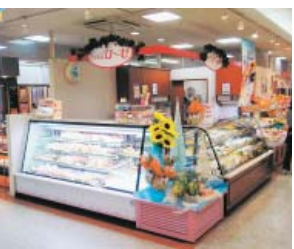
季節に合った多種類の洋菓子

以上を目指したいと思っております。 平成十八年十一月には、イオン高岡シヨッピングセンター内に二店舗目がオープンしました。