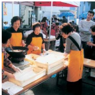
揚げたてドーナツのふるまい

十七日(日)、上市町西中町商店街・カミール周辺で、フリーマーケット・ワゴンセールを中心に開催される。商店街にぎわい創出事業として、今年は六月から十一月まで(八月を除く)月一回開く予定。