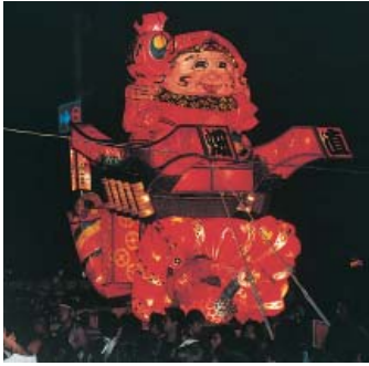
勇壮な夜高あんどん

街を祭り一色に彩る庄川観光祭は二日(土)、三日(日)の両日開催され、たいまつ行進や川面に流れる七色の灯籠など、華やかな光のファンタジーを繰り広げます。勇壮な夜高あんどんの町練りや、シーズントップを切って行われる花火大会は、多くの観光客を魅了します。