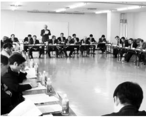
合併内容を慎重に審議

新商工会での事業推進に直接的・間接的に関わりのある団体等の事務については、従来どおり継続して受託する。一方、同業種的な団体及び事業内容が親睦団体に近いものについては、事務の取り止めを前提に見直す。