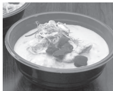
おやべホワイトカレーそば

つも後味がくせになるようなピリ辛に仕上げた。具材には、小矢部ブランドの鶏肉である「火ね鶏」と地元産玉ねぎを使用。そばはカレーソースによく絡むよう地元業者に依頼した特製の細麺とするなど、あくまで小矢部産にこだわっている。