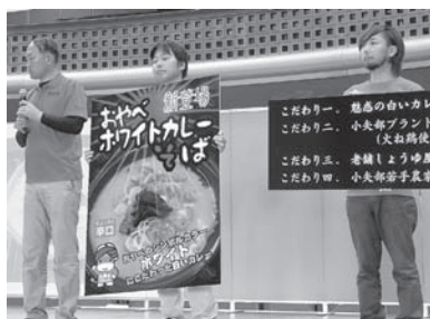
イベントでPRする青年部

昨年四月から試作を重ねてレシピを作ったホワイトカレーソースは、牛乳とココナッツミルクをベースにまろやかにしつ