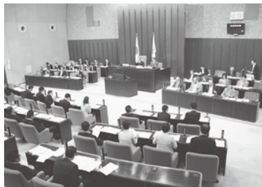
26日本会議にて可決

本条例は、施策の推進や関係機関との連携を図る県の責務のほか、地域社会を構成する中小企業に関する団体、地域金融機関、研究機関、教育機関、大企業、県民の役割等を定め、基本理念のもと地域社会が一体となった中小企業支援体制を構築することを目的としています。条例の主な概要は、左記の通りです。