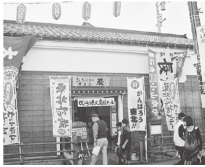
さんちよんぴん蔵

今年には北海道から沖縄まで全国の特産品を模索し、地域限定特産品を販売することで魅力向上を図っている。更に福岡つくりもんまつりに県内外からの集客向けの特産・お土産商品や、ゴルフコンペの賞品等に利用していただけのような企画を取り入れている。