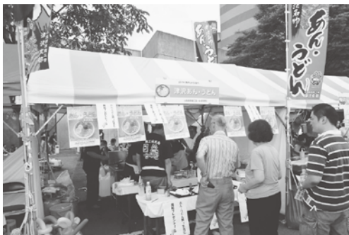
津沢あん・うどんの店にも行列が