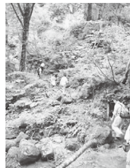
立山山麓の地域資源調査

としても視野に入れ、全国展開市場に進出することを想定とした情報発信力強化調査事業も並行しながら遂行する。「こころしさ食」と「伝える力」と「観光資源」が絡むことで、商工会、地域関係機関や参画事業者が一体となった事業コンセプト「五感の、立山山麓」を、どのように顧客に伝え、集客に導くかを探っていく。