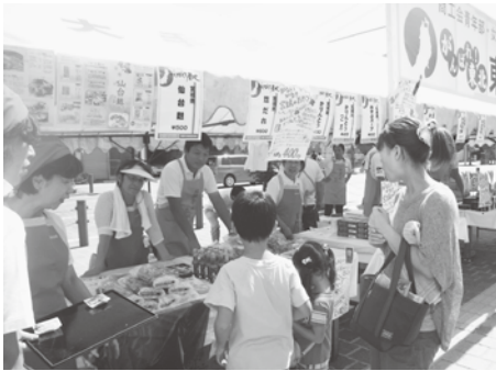
がんばれ東北！特産品販売

販売当日は青年部女性部員がお揃いのユニフォームで、「いらっしゃいませ。東北の特産品はいかがですか」と来場者に笑顔で挨拶し商品説明・PRをした。販売した商品の中でも女性部員の方が試食品を作ってきた宮城県の仙台麩は子供から年配の