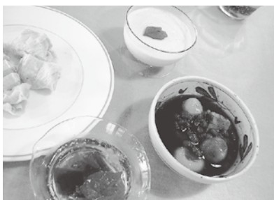
試作したぜんざい、ゼリー入りサイダーなど

同商工会では「利賀スイーツ」を新名物として、東海北陸自動車道を利用する観光客の土産品の目玉となるようイベントなどで提供していく。