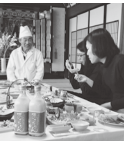
「まごたりん」と地元の料理に舌つつみを打つ台湾からの観光客

▼外国人観光客を取り込め 一方、どぶろくと、地元食材とのコラボにも取り組み、利賀の行者にんにくとの料理マッチングでは、マスコミに大きくとらげられた。また、富山県の台湾向けPRとして、冬の魅力「利賀のどぶろくと雪遊び」が台湾に紹介され、台湾からの観光客も訪れ、どぶろくを活かした地域活性化にも貢献してきている。 この事業を契機として、今後売れるモノづくり、売れる製品開発、どんな付加価値を付けるか、様々な可能性を求め、「聴きます! 効きます! 利きます!」の気持ちで積極的に地域資源の活用を支援していきたい。