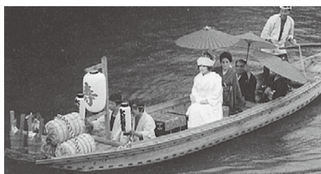
新郎が待つ向こう岸へ渡る嫁入り舟