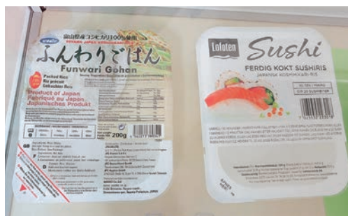
海外向けパッケージ(上)と 国内で販売されている商品(下)

現在は生産量全体の一%程度が海外向けとなっているが、来年四月の新工場完成後は生産量が一・五倍となる見通しで、海外への年間輸出量は現行の四倍となる百万食を目標にしている。