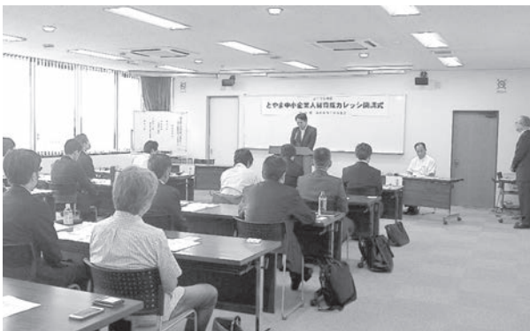
開講式で挨拶する柿沢昌宏県商工労働部次長

県内経済・産業を支える中小企業に、リーズナブルで質の高い研修を実施し、中小企業の人づくりを支援する、富山県の委託事業である「とやま中小企業人材育成カレッジ」長期コース(リーダーのための経営視点・スキル育成コース)の開講式が六月二十二日に実施された。