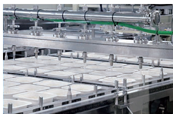
一食ずつトレイ容器のまま クリーンルームで炊き上げられる (個食炊飯方法)

豊富な地下水、品質の高い富山米、関東・関西・中部地方からほぼ等距離で災害の少ない立地、補助金を含めた優遇措置などが工場設立の決め手となり、「入善海洋深層水団