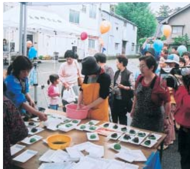
草餅ふるまいの行列

フリーマーケットではリサイクル雑貨や衣類、野菜等が販売され、また、商工会女性部、おかみさん会によるどんぶり焼・各種ふるまいのほか、町内伝統芸能の発表等盛りだくさんのイベントが行われる。