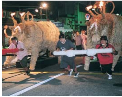
巨大な火牛を引いて全力疾走

二十一日(金)～二十二日(土)二日間にわたり、源平火牛まつりが開催される。 二十一日(金)は前夜祭で、津沢地区において火牛パレードを行う。 二十二日(土)は、小矢部市植生八幡宮で安全祈願祭を行い、石動商店街で、台車を付けた高さ二・五メートルのわらで作った巨大な火牛を引いて百五十メートルのコースを全力で疾走して速