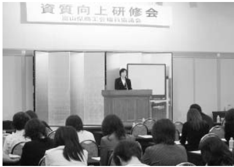
総会に先立ち行われた資質向上研修会

坊さんは、日頃の業務で実 際に起こりうる事例を取り上 げ、ビジネススマナーでは、接 客や電話応対の常識について、 また、改善の着眼点では、見 直しの習慣が無い組織が非常 に多い中で、今の仕事のやり 方が本当にいいのか、もっと 利用満足度を上げる仕事の方 法がないかも一度振り返る 必要があることや、個々のレ ベルが高くてもそれが組織と して反映させなければ意味が なく、組織全体のレベルアッ プを図り、利用される商工会 づくりが求められていると話