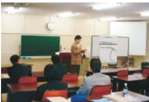
調査研究結果を発表

各青年部は、地域の観光・特産品・歴史等について調査研究を行い、模造紙やパワーポイントを用いて、他の地区の青年部員にわかりやすく説明することでプレゼン能力の強化も図った。