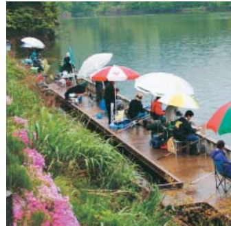
ヘラブナ釣りを楽しむ参加者

二十一日(日)午前六時から十一時(雨天決行)にかけて井口の名勝の地、赤祖父湖で開催される。