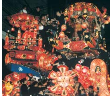
勇壮華麗な大行燈

夜高行燈を御神燈として、一日・二日の両晩、町内を練りまわる夜高祭は、三百年の伝統を誇る優美で雄大な祭り。 午後七時より、行燈の町内練り廻しが始まり、小中行燈は九時半くらいまで、大行燈(高さ七メートル)は十二時まで、そそのいのハツピ姿の若衆たちが「ヨイヤサ、ヨイヤサ」の勇壮な掛け声のなか、町内の行燈が競うように引き