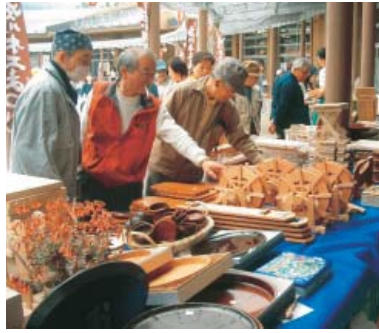
木工品を買い求める来場者

この庄川町特産の「庄川挽物木地」匠の技を集めた作品の展示販売のほか、色々な銘木、奇木などを販売する木材おもしろ市、ミニロクロや木工品絵描きの体験コーナー、