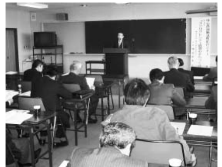
お店への吸引力は個店の力で

講師は、行政は、街中に人通りを増やすことについて、は目標とするが、店に入るかどうかは個店の力である。客は、買い物をするために店へ来る」の原点に戻り、品質、値ごろ感、良品ということを前面に打ち出し、積極的な商売の手法を築いていただきたいと結んだ。