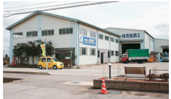
総合建設企業として業態を拡大

十年前、二代目社長となり、CMでお馴染みの「レオパレス」等を主な取引先に、飛躍的に売上を伸ばしてきました。