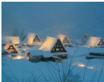
合掌家屋を幻想的に冬の夜にライトアップ

利賀村 初午祭り ルーンショーが演じられる。当日は年末大売出しの富くじ抽選会やスタンプ会の協賛イベント等も繰り広げられる。