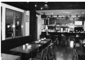
地域交流スペース(レストラン店内)