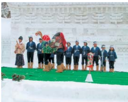
初午を行う子供たち

初午は、約百八十年前から利賀地区に伝わる民俗行事で、ワラ馬の頭を仕立てて、深い雪を踏み分けながら各家々を訪ね廻り、家内安全と農産物の豊作祈願をする。その神事(俵ころがしや太鼓たたきなど)の一切が子供だけで行われる行事。