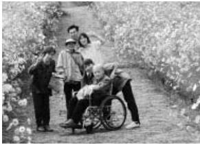
施設利用者との一コマ

しています。小規模多機能型居宅介護では地域の第二の家庭としてのくつろぎの場を提供し、「通い」「泊まり」「訪問」サービスで24時間365日切れ目ない介護