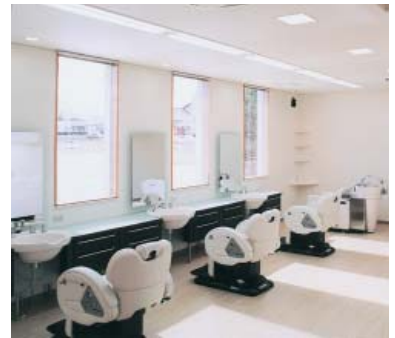
清潔感漂う明るい店内

店は、国道四十一号線沿いに立地、近くに大沢野中学校があります。店の特色として、短時間・低料金を売りにする理容チェーンの進出、男性客の理容離れが進む中、価格を下げないでお客様の信頼を得る努力として、オプショニングを設定し、「育毛コーズ」では、頭皮の除去、シャンプーマツサージをお試し価格五百円で提案、また、「カラー(白髪ぼかし)」「ヤ」「ロングカット」「カラーリング」各種パーマクリスタルストレート(縮毛矯正)などで若年層にアピール、また、女性専用室を設置し、女の子を対象に「前髪カット」「お顔剃り」、大人の女性を対象に「フェイ