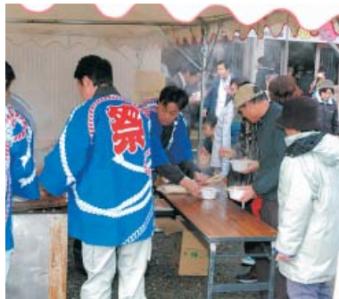
熊なべ、先着千名様に無料

戸出 新春熊なべ祭 十三日(日)午前十一時から午後二時まで、戸出体育館において開催する。 冬の商店街を賑わいとふれあいの場として消費者に提供し、住民との親睦を深めることを目的に行っているもので、今年は、熊鍋が先着千名に無料で振る舞われる。また、児童によるもちつき&おにぎり・こんにやく販売、ふるまい酒などのほか、商工会女性部のヨサコイ踊りや大道芸パ