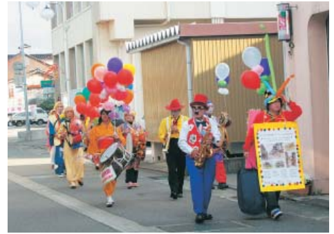
アートフェスタをPRするチンドン