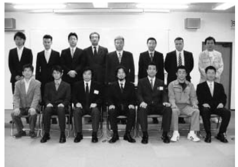
研修を修了した経営後継者・幹部候補者

成コース」の閉講式がこのほど、県中小企業研修センターで行われた。 黒崎県商工労働部商業流通課長が、同コース修了者の県内企業の幹部候補者ら十六名に、それぞれ修了証を授与し、本年七月四日開講以来、五ヶ月間、延べ二十四日間にわたる研修を終了した。 この後、会場を移し懇談会を行い、二十四日間の研修を振り返り、お互いの健闘をたたえあうとともに、「研修で得たことも多くあるが、日頃得ることができない異業種の方との交流ができたことも大きな成果である」と語り、これから交流を深めることを誓い合った。