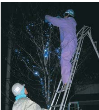
LEDを取り付ける青年部員

この事業は、平成十五年から青年部が始めたもので、今年からはLEDに取替えて飾り付けた。来年二月末までの期間、毎日午後五時から翌日午前零時まで点灯される。