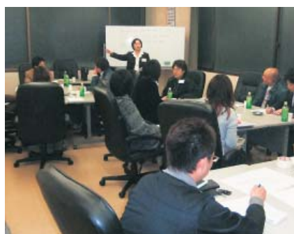
呉羽なしの活用方法について話し合う参加者

梅が求められる。その上、返品を受ける。小規模メーカーの実態である。一円のコストを競う生産現場を知れば、小売店の促進活動はもっと積極的になるはずである。