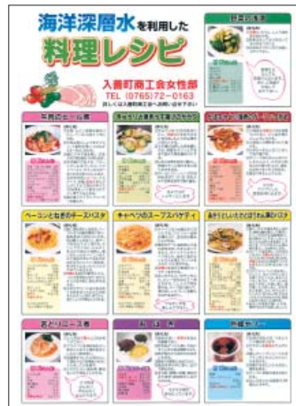
ミネラル豊富な海洋深層水を利用した料理レシピ

高いかを勉強し、五回の試作から手軽に深層水の利用が可能な料理を選定し「海洋深層水を利用した料理レシピ」を製作した。