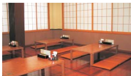
家族づれもゆっくりくつろげる店内