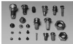
多種多様なネジに緩み止め加工が可能

もう一つは、精密電機、電子製品の組み立て時、ねじ穴に金属バリが残留していると落下する恐れがあり、落下すると電気ショートなどが発生、重大な事故を引き起こし、高価な製品を駄目にするケースが多少あった。この問題の解決を図るため、金属バリの付着力を強くしてバリの落下を防止し、かつ締めこんだ後は、高い固着性を有して