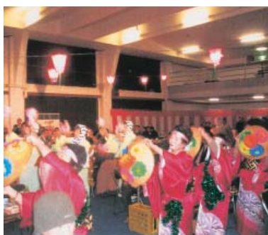
色あでやかな花笠おどり