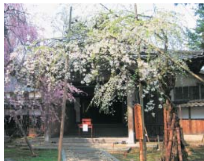
善徳寺の樹齢350年になるしだれ桜

七日(土)〜十五日(日)、城端別院を中心とした市街地において城端しだれ桜まつりが開催される。