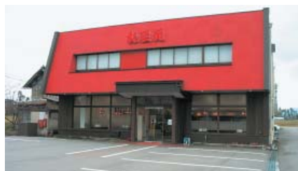
駐車スペースも広く赤を基調にした建物

現在、外食をする人々が求めているのは、単にお腹をいっぱいにするためのおいしい料理だけではなく、それ以上に「心の充足感」をもとめています。そんな時代だからこそお客様にお食事と「食文化」を提供していきたいと考えています。