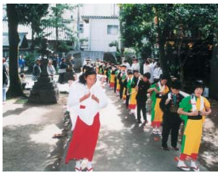
早乙女姿やみこ姿の児童たちが踊りを奉納

この祭りは、織田信長が石山本願寺を攻めた時に、門徒が本願寺を助けにいったところ、当時の天皇の命により和解となり、平和を喜んで踊ったのが起こりといわれ、四百年以上の歴史がある。