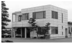
㈱ニッセイテクニカ社屋

当社は、ねじの形態、サイズ、素材等が多岐にわたる中で、それぞれのねじに最適な緩み止めのプレコート加工を施している。緩み止め剤液は、住友スリーエムの製品をはじめ、自社開発の広範囲にわたる用途に応じた製品(マイクロカプセルタイプ(固着タイプ)(樹脂タイプ)(抵抗タイプ))で、安全性と信頼性を高め、かつ高度な技術