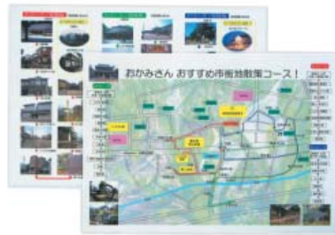
街なかの散策コースを紹介した手作りマップ

さわしい食べ物として、シルクパウダーを入れたコロツケを考案していた。今回、さらに店先で城端中心部の観光散策コースを簡単に紹介できるようにとマップにまとめてみた。