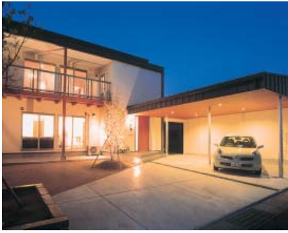
シンプルモダン住宅

育成です。従業員の技術力を向上させることが顧客満足を得るための最優先事項と考えている。顧客のイメージするものを完成建築物として提供する