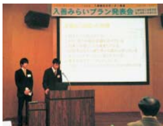
入善町の観光資源活用を提言する富山国際大生

沢の沢杉の間伐材を利用した土産品の開発」「発電所美術館での演劇やイベントの開催」