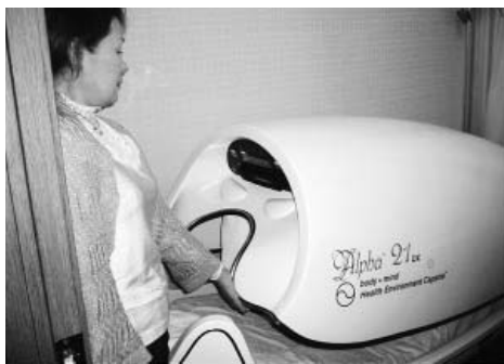
心と身体の疲れを癒すリラクゼーションカプセル

平成12年12月31日以前に取得したのであれば、原則として譲渡益に15%の所得税(他に住民税5%)がかかります。 譲渡益 不動産を売った金額からその不動産を買ったときの金額(取得費)と売るときにかかった費用(譲渡費用)を差し引いたものが譲渡益です。 取得費が不明のときは譲渡金額の5%を取得費とします。 居住用土地 居住していた不動産を売却した時は、3千万円までは税額がかからない特例がありますが、申告要件となっています。 (税理士 菅原昌仁)