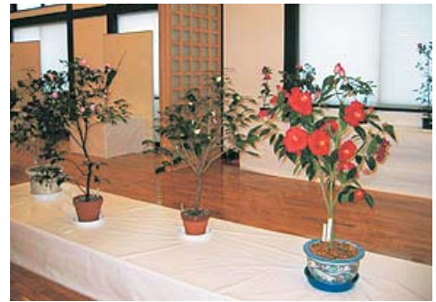
色鮮やかなツバキが並ぶ