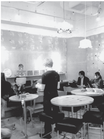
コーヒーを飲みながらデータ作成の講習会

▲Fabはもともと、アメリカのMIT大学のニールG教授が著書「ものづくり革命 パーソナルファブリケーションの夜明け」で提唱したコンセプト。「Fab Lab (ファブラボ)」として、3Dプリンター等ハイテク工作機械を備えた一般市民のためのオープンな工房ネットワークが形成されており、世界中で同様の取り組みが行われている。日本でも渋谷以外に鎌倉や筑波に活動拠点がある。今後、益々時代の新しいモノづくり拠点に波及するだろう。