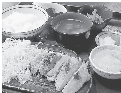
人気メニューの太陽定食

うかりよく)のある麴が醸し出すきめ細やかなで上質な甘み・香りが美味しさの秘訣となっている。