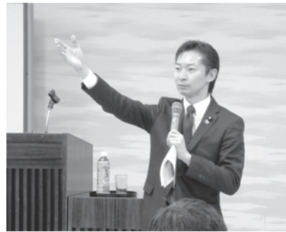
参議院議員 宮本周司氏