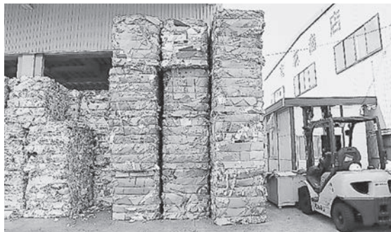
種類別に分別しプレス加工した古紙

国内市場は下落し、回収業者も廃業に追い込まれ、焼却処分を余儀なくされている現状に「もったいない・・・何とかならないか」と考えていた。