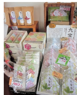
メグスリノキの九宝茶

富山では古くから薬用植物が豊富に自生しており、江戸時代には全国各地を廻る「越中の売薬さん」が広く知られるようになり、今でも薬膳文化は脈々と受け継がれている。 ここ上市町の大岩山日石寺では折袴日にメグスリノキのお茶を振る舞う風習があったことからヒントを得て、(株)ティー・ツリー・コミュニケーションズは、そのメグスリノキをベールにブレンドし、物産展等にて商品マーケティングを重ね、商品化したのが「九宝茶」である。「九宝茶」は、古くから「長者の木」や「千里眼の木」と呼ばれ親しまれてきたメグスリノキを中心に、九種類の葉やハーブを飲みやすくブレンドした和のハーブティーとなっている。九宝茶シリーズとして五種類ラインナップされ、その日の気分で様々な風味を楽しめる。