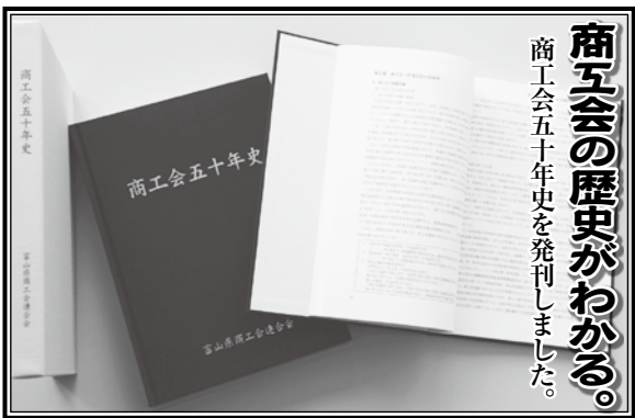
商工会五十年史を発売しました。

その他にも注意する点がいくつかあるが、案外、農家のお母さんグループに学ぶ点が多い。いろいろと課題はあるが、加工特産品開発には一定の手法があり、それさえ習得すればそんなに難しくないようである。