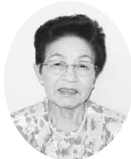
再任された夏野会長