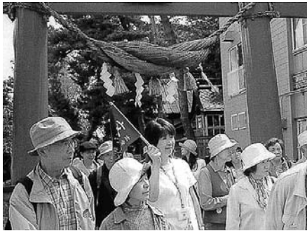
太宰ゆかりの地を巡るかなぎ文学散歩

元気倶楽部の自立の核となっているのは、太宰治記念館「斜陽館」と「津軽三味線会館」の運営だ。もともとは市が運営していたが、〇七年から元気倶楽部が指定管理者として受託運営を開始。以来、両施設抱き合わせで黒字運営を続けている。