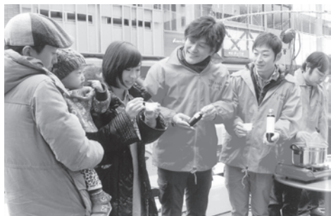
総曲輪グランドプラザにて試食展示会

このアンケート結果をもとに改良を加え、今後は地元産品を組み合わせたレシピの研究も進め、来年の北陸新幹線開業を見据えて部員達はこの事業にますます熱が入っている。