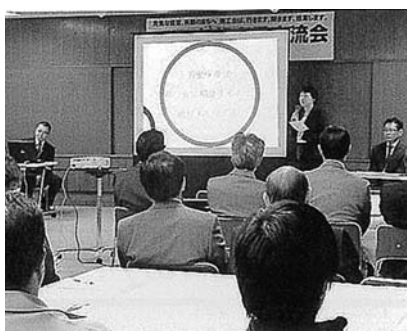
経営指導員によるプレゼン

第一部の事業内容説明会では、商工会を活用してもらうためには商工会職員がまず魅力を知ることが大切であるとして経営指導員による支援事例を発表した。販路拡大や新商品開発、情報発信、資金調達等、バライティに富んだ内容で、参加者も