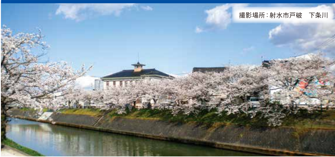
撮影場所：射水市戸破 下条川

令和2年4月1日発行 編集・発行 射水市商工会 〒939-0351 富山県射水市戸破4200-1 救急薬品市民交流プラザ内 TEL 0766-55-0072 FAX 0766-55-3177