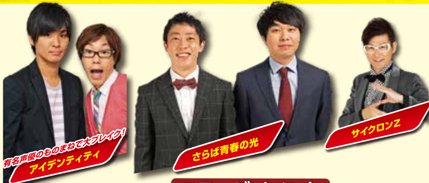
有名声優のものまねで大ブレイク! アイデンティティ