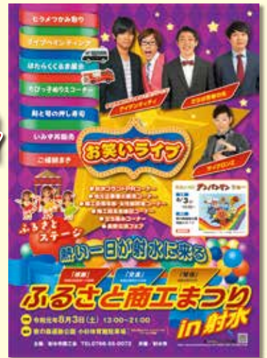
ふるさと商工まつりin射水ポスター