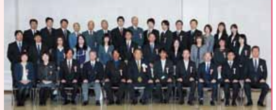
企業の繁栄に尽力 優良従業員表彰