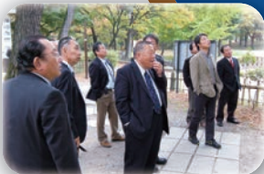
長野県視察研修 (千曲市など)