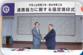
連携交流に関する調印式 (戸倉上山田商工会)