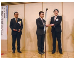
(株)日吉プランナー