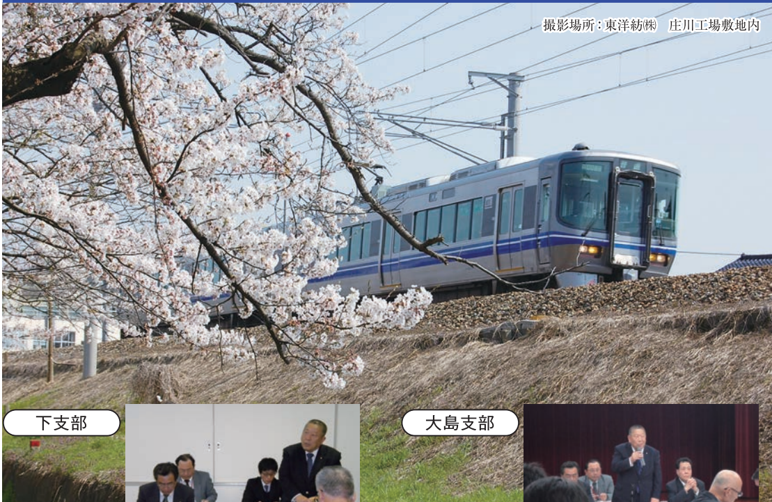
撮影場所：東洋紡(株) 庄川工場敷地内