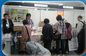
かがやきとやま逸品フェスタ (富山県民会館)