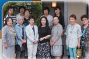
女性部意見交換会 (射水市商工会)