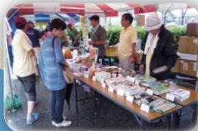
長野県交流フェア (ふるさと商工まつりin射水)