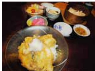
げんげ井(いみず井)