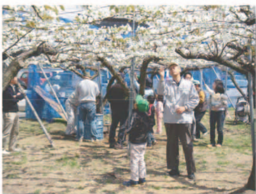
住民による受粉作業 (23.4.29)

ターゲット層にあわせた商品プロモーションを展開し、商品の認知度・ブランド力を高めていく。また、販路開拓にあわせて各種イベントへの出展や各種メディアへの露出を高めるPRの強化を図る。