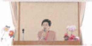
平成23年度 射水市商工会女性部 総会